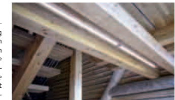
Die LED-Beleuchtung integriert sich nahtlos in die Holzkonstruktion des Biomasse-Heizwerkes.