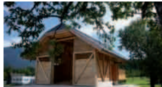
Derzeit zählt der Energieerzeuger 15 Abnehmer, die durch die Vorzüge der KNX-Technik kundenoptimiert zusammengeführt wurden.