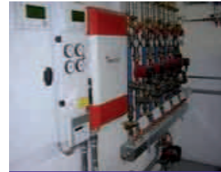
Das installierende Elektrounternehmen Engljähringer fand einen Weg die BACNet basierende Regelung des Heizwerkes und den KNX auf Automatisierungsebene zusammenzuführen.

sowie in die Außenbeleuchtung in Abhängigkeit von Dämmerung, Uhrzeit und Jahreszeit ein und sorgt auch für die Gartenbewässerung nicht ohne den Niederschlag zu berücksichtigen. »Selbstverständlich haben wir auch die Beschattung Teil des KNX-Systems werden lassen. Und Features wie die Grundwasser-Spiegelüberwachung der Hausbrunnenanlage, die Pegelmessung des Wolfgangsees, eine Seewasser-temperaturerfassung sowie die Steuerung der Pasterisierung in der Käseerei sind als Ausbaustufe noch im heurigen Jahr geplant. Eine Photovoltaikanlage auf dem Dach eines anderen Gebäudes und deren Einbindung an die KNX-Anlage ist derzeit ebenso angedacht«, so Engljähringer.