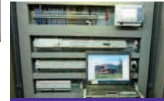
Sauber installierte Technik, die noch dazu die Möglichkeiten der Visualisierung schafft und damit den Kunden praktische Features bietet.

erleben die Kunden keine Überraschung, wenn sie die Heizrechnung bekommen – sie können diese Informationen stets aktualisiert abrufen. Die Anlagenbetreiber haben innerhalb der Visualisierung Zugriff auf alle Parameter – die Wärmekunden hingegen nur auf jene, die sie in ihrer eigenen Anlage verstellen können: »Selbstverständlich können die Kunden die Temperaturen der Heizregeltechnik in den eigenen vier Wänden online verstellen.«